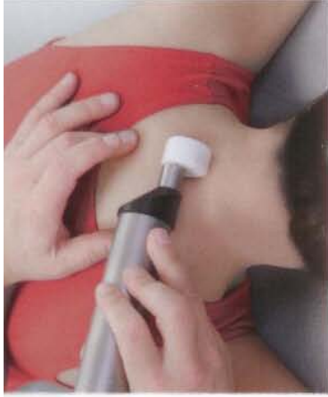
▲ Nackenbehandlung ▼ Schulterbehandlung