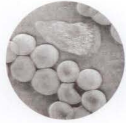
Zellen, umgeben von extrazellulärer Matrix

Die Matrix-Rhythmus-Therapie ist eine aus der zellbiologischen Grundlagenforschung der Universität Erlangen entwickelte Behandlungsform. Mit Hilfe der Vital-Video-Mikroskopie entdeckten die Forscher eine neue Welt der physikalischen Therapie-möglichkeiten.